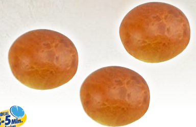
Art. 2390* FF-Mini Brioche Burger

Maße: Ø7,0 x H4,5 cm Gewicht: 30 g, 70 St./Kt. ❄️ fertig gebacken