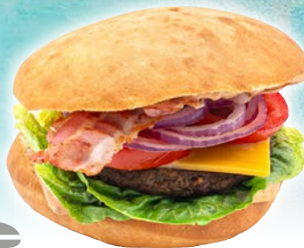
Art. 2357* FF-Brioche Burger, geschnitten

Maße: Ø11,0 x H5,0 cm Gewicht: 100 g, 44 St./Kt. ❄️ fertig gebacken