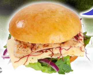
Art. 2679* FF-Glossy Brioche Burger 4-Inch

Maße: Ø10,0 x H5,0 cm Gewicht: 80 g, 60 St./Kt. ❄️ fertig gebacken