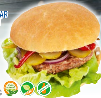
Art. 1600* FF-Gourmet Burger rund, geschnitten

Maße: Ø12,0xH4,5cm Gewicht: 100g, 40 St./Kt.